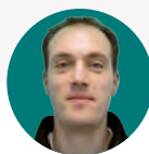
Rodolphe MIGEON, ambassadeur à Parthenay