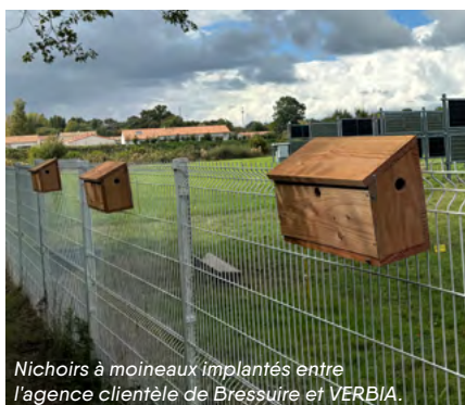
Nichoirs à moineaux implantés entre l'agence clientèle de Bressuire et VERBIA.

Chaque site a vu émerger des initiatives, des échanges et des idées nouvelles.