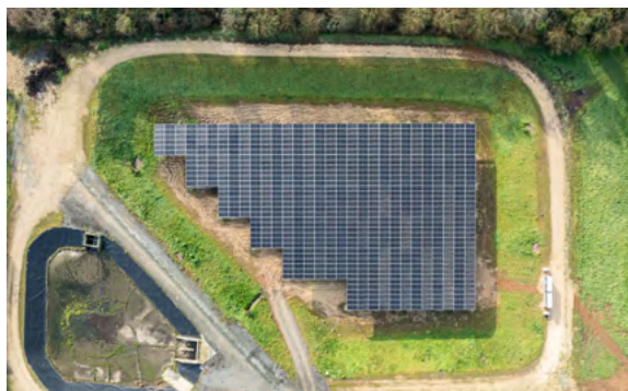
SOLEÏS, une ombrière photovoltaïque sur un bassin d'orage

Avec ce projet, Séolis PROD confirme son rôle d'acteur majeur de la transition énergétique locale et réaffirme son engagement pour une énergie durable.