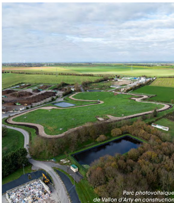
Parc photovoltaïque de Vallon d'Arty en construction

Le chantier du site de Vallon d'Arty a démarré fin octobre. La centrale disposera d'une puissance installée de 2,9 MWc, reposant sur 4 752 modules bifaces et 9 onduleurs. Elle produira chaque année 3 500 MWh, soit l'équivalent de la consommation électrique de 1 400 foyers (hors chauffage et eau chaude sanitaire), tout en donnant une seconde vie à un site en reconversion.